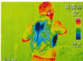
アイスハーネスあり 運動30分後

(左図) 全体的にオレンジ〜赤の高温となり 体温が上昇している のがわかる。背中・腋の下には大量の汗をかき、その部分が青くなっている。脱水状態になり 熱中症にかかる危険性が高まる 。